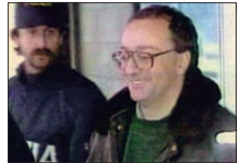
L'arresto di Izzo ieri a Campobasso.