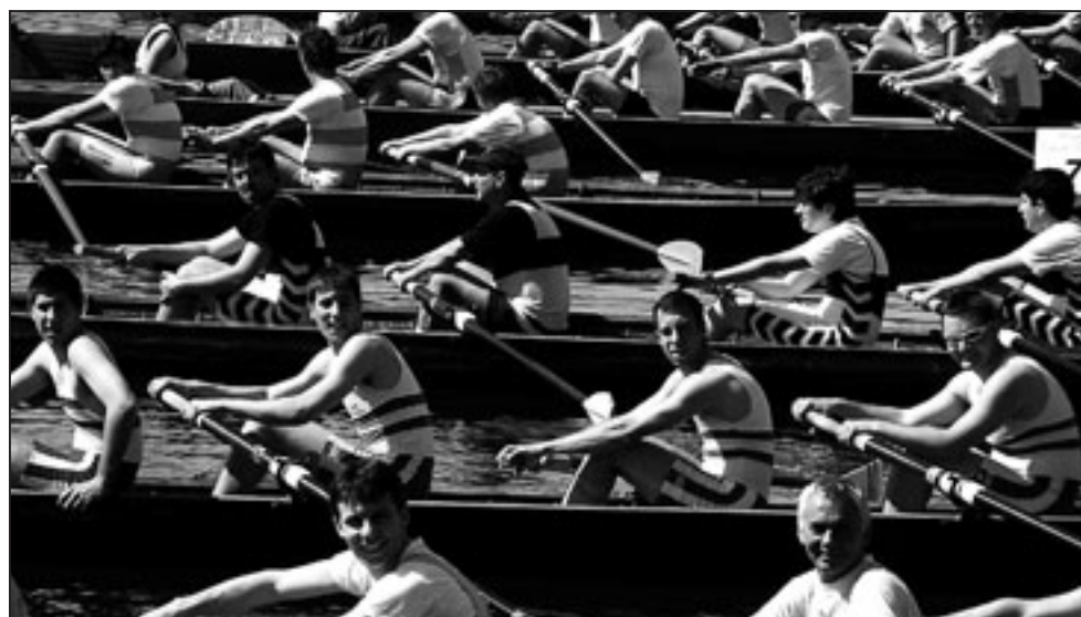
La partenza degli equipaggi impegnati nella gara della yole a 4.

TRIESTE Successo di partecipazione nella prima giornata della Bavisela che ha visto la disciplina del canottaggio aprire le danze nel salotto buono della città, quel bacino San Giusto e Molo Audace che hanno ospitato in tarda mattinata (erano le 10,30), oltre 200 vogatori di un po' tutte le realtà regionali e della vicina Slovenia, ripartiti in una cinquantina di equipaggi. Dal canoè ad un vogatore alla yole a 8 presenti all'appello tutte le specialità del tipo regolamentare, presenti da sempre nella tradizione centenaria triestina del canottaggio.