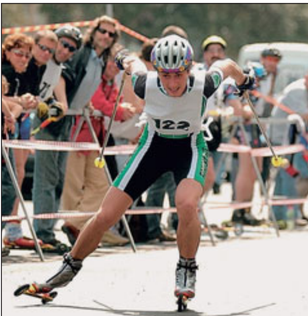
Folla sulle Rive ieri alla gara di skiroll.

TRIESTE La Bavisela 2005 è partita ieri sulle Rive di Trieste con il tradizionale taglio del nastro del Villaggio Bavisela, che ha aperto le sue porte a migliaia di visitatori dei centottanta stand messi in piedi quasi tutti dagli organizzatori. Una fiera espositiva che l'8 maggio farà da cornice alla maratona d'Europa, alla maratona dei due castelli e alla classica non competitiva che da Miramare arriverà fino in piazza dell'Unità.