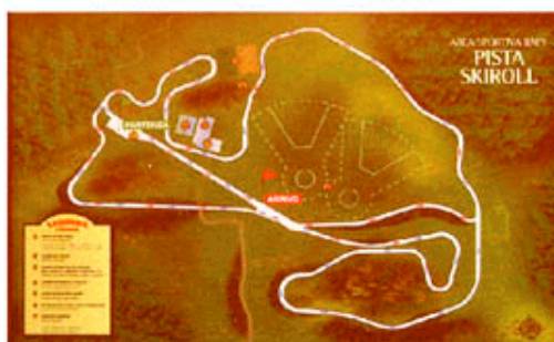
Pista di Skiroll di Rapy (Verrayes) Rapy (Verrayes) rollerski track