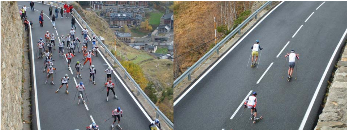
Sortie Circuit Court