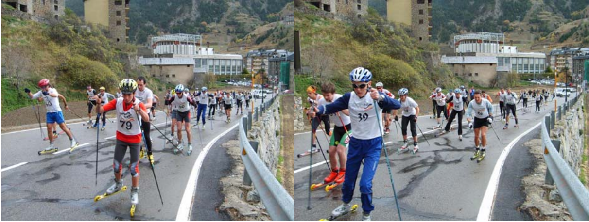
Sortie Circuit Long